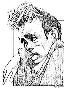
Ungdomstid gir utfordringer - rotløs eller ikke. (Ill. Kåre Brynne Julvsrud - copyright)