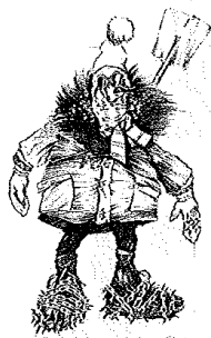
Lytt til erfarne fjellfolk.

Vi har en klubbleder (les meg) som styrer hele virksomheten. Jeg er ansvarlig for innhold, på ungdom og administrativ drift av hele huset. Når det gjelder junior har jeg en leder som styrer den klubben i forhold til innholdet. Jeg er fortsatt ansvarlig for personal og økonomi. "...". I Ski var klubbene underlagt hver sin ungdomsskolerektor i 5 år og det var ikke bra, verken for økonomien eller for det faglige. Jeg mener at den optimale organisasjonen for oss hadde vært: en sentralt plassert ungdomssekretær / ungdomskonsulent og de 4 klubblederne derunder. I dag har vi fire klubbledere som alle rapporterer til kultursjefen direkte. Bra på mange måter, men kultursjefen har veldig mange oppgaver og har ikke alltid tid til oss."