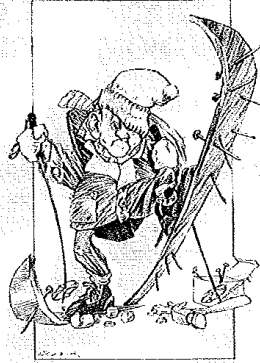
Vi er på vei! (Ill. Kåre Brynjulvsrud – copyright)