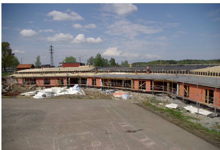
Byggingen av Solberg barnehage går etter planen og vil stå ferdig ca 1. desember.