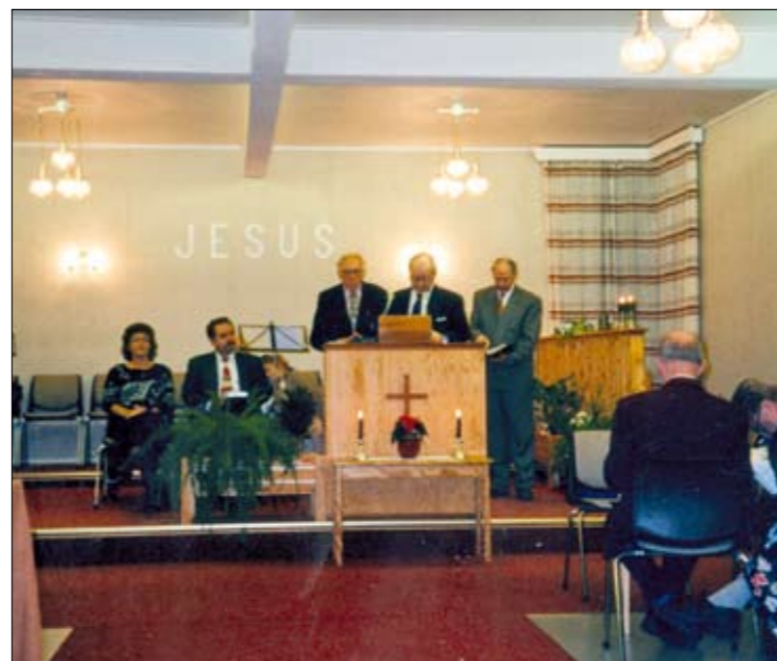
Forstanderinnsettelse i 1989.