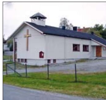
Fredheim slik vi kjenner den i dag.

Øst for Ås stasjon og godt synlig fra riksveien gjennom Ås får man lett øye på et spesielt hus med et stort kors på veggen. Huset i Solfallsveien 6 er i dag det faste møtelokalet for pinsevennene i Ås, men få kjenner til at det startet som blikkenslagerverksted.