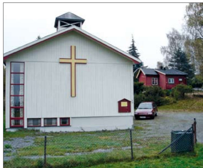
Evangeliesalen med den lille hytta Freidmann først bygget i bakgrunnen.

Freidmann først bygget i 1921 står der fortsatt og brukes som bolig. Den har i de senere år blitt noe større ved at en glassveranda er bygget inn.