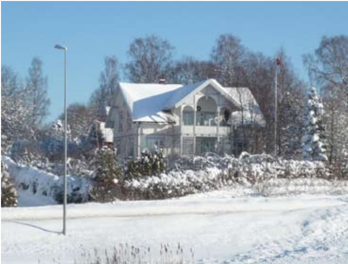
Breidablikk, Drøbakveien 23 vinteren 2009

av minst kr 3.000. Trolig ble ikke huset innflyttingsklart før i 1907.