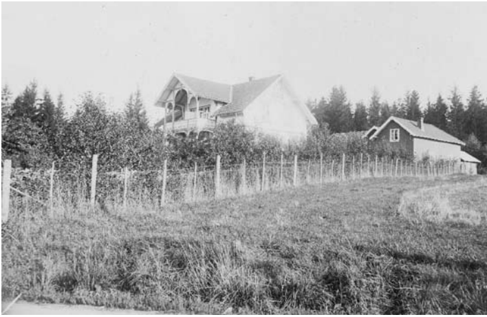
Breidablikk ca 1910.