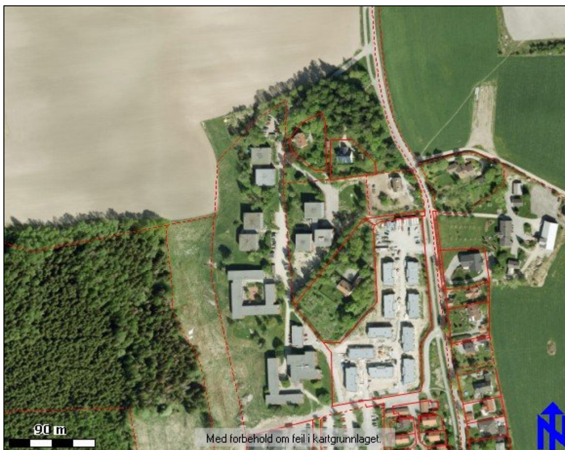
- ortofoto av planområdet -

Dyrø & Moen AS Arkitekter MNAL har på vegne av Studentskipnaden i Ås utarbeidet forslag til endret reguleringsplan med bestemmelser for Pentagon m.m. Planområdet er på ca 60 dekar og består av studentbyen Pentagon, 3 boligtomter, grøntområder og parkeringsplasser. Avstand fra Ås stasjon er ca 1,5 kilometer, det vil si at beliggenheten er i gangavstand fra Ås sentrum.