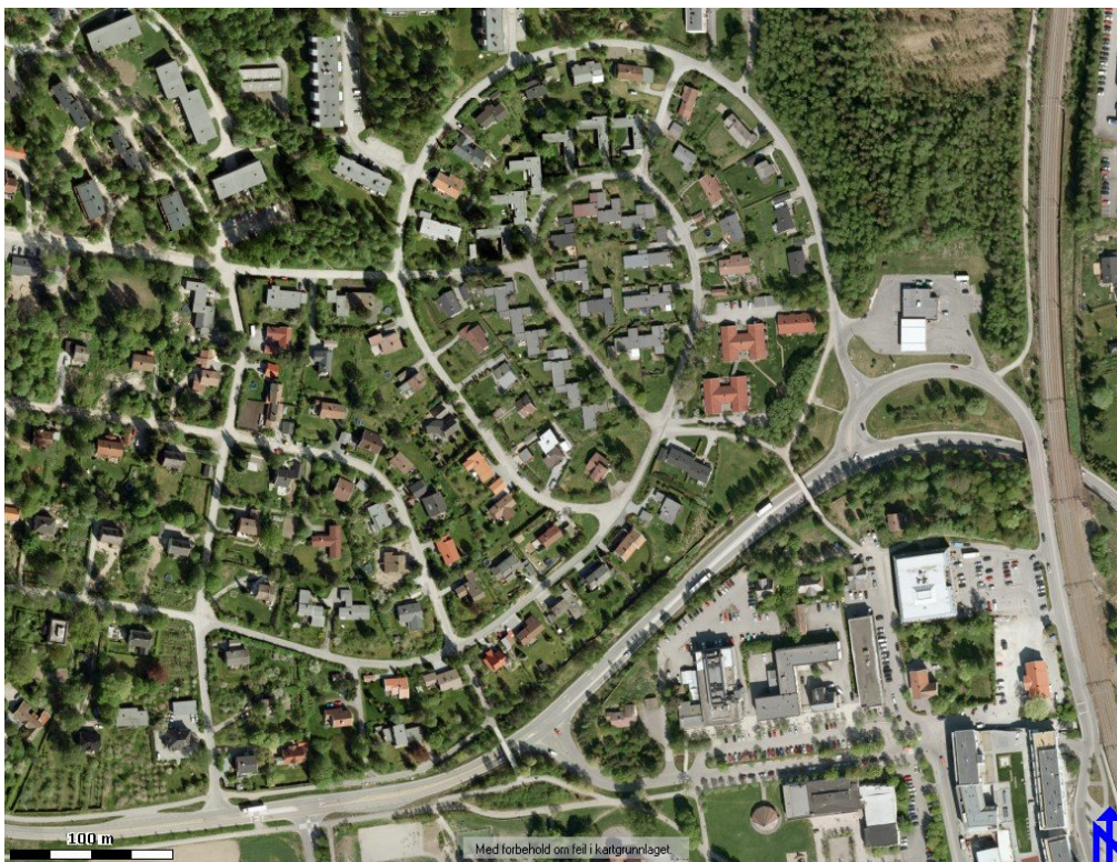
Ortofoto av planområdet og nordre del av Ås sentrum

av Skogveien i vest og fylkesveien i sør. Området er i henhold til kommuneplan for Ås 2011-2023 disponert til boligformål med innslag av grøntstruktur.