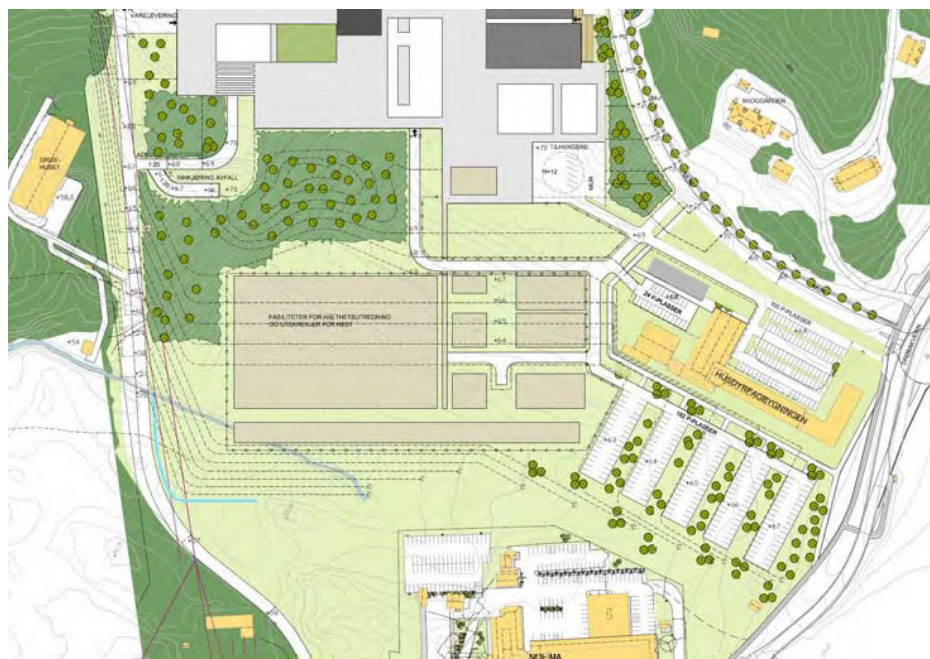
Utsnitt fra illustrasjonsplanen viser hvordan jorden mellom Nofima og IHF kan tenkes utformet.

Deler av området vil benyttes til parkering, da det har vært vanskelig å finne tilstrekkelig med parkeringsplasser innenfor byggeområdene. Det er i utgangspunktet negativt å benytte landbruksareal til parkering. Gitt at størstedelen av jorden likevel skal omdisponeres, vil restarealet ikke være drivverdig."