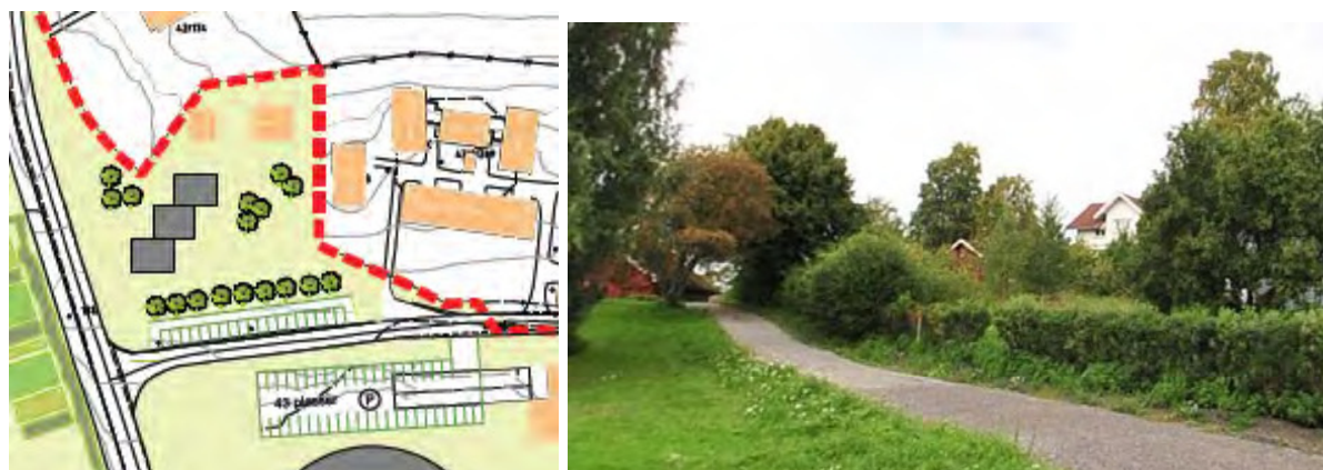
Forslag til organisering av barnehagetomten. Foto viser tomten med sveitservillaen i bakkant.

I forslag til reguleringsplan er to bygninger nord i feltet avsatt til spesialområde bevaring. Ny bebyggelse skal innordne seg og tilpasses disse. Det er gitt bestemmelse om parkering, hvor innkjøring og avlevering gjøres fra Utveien. Det er regulert gang- og sykkelvei fra Meierikrysset langs østsiden av Kirkeveien til innkjøringen til Syverudveien. I møte 10.11.2011 vedtok hovedutvalg for teknikk og miljø at det legges inn en rekkefølgebestemmelse for denne, slik at den skal ferdigstilles før det gis igangsettingstillatelse til bygging av barnehage i Utveien 4. Nye bygg for en barnehage med 3-4 avdelinger foreslås lagt i tre bygningsvolumer som vil tilpasse seg det stigende terrenget på en god måte, se figur under. Det vil dannes et tun og utearealene vil være orientert mot sør.