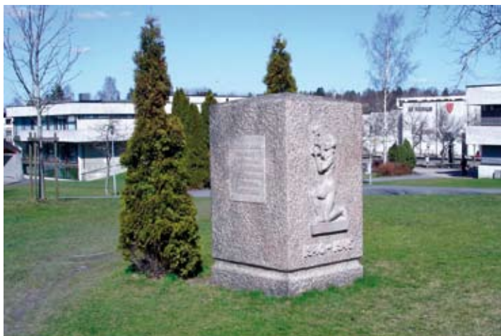
Minnestenen i dag.

..... Vi er kommet sammen for å avduke et minnesmerke over siste verdenskrigs ofre fra vår bygd. Vi har ikke valgt å hugge merket i marmor, men i granitt – det mener vi er best for nordmenn. Det motivet som vi har valgt, er ikke tatt fra krigens hårde gru, men fra det som vi ønsker – håper og ber om må komme etter det ragnarok som