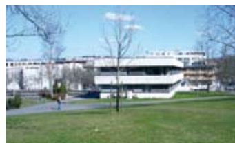
Samme motiv i år.

17. mai samling av barnetoget i 1952 som var nede på plenen nord for Minnестenen. Denne ordningen opphørte på begynnelsen av 1960-tallet.