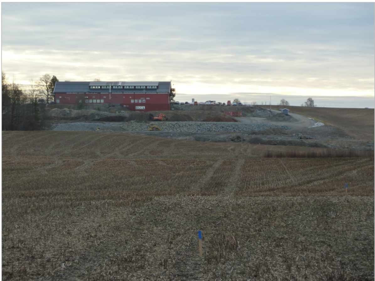
Figur 3 – Planområdet med brannstasjonen sett fra Nyveien nord for området. Moreneryggen med Fv 152 vises som en tydelig forhøyning i landskapet.

Selve planområdet er sterkt bearbeidet, med brannstasjon og gjenvinningsanlegg. I tillegg finnes det en kunstig anlagt grunnvannsdam i området.