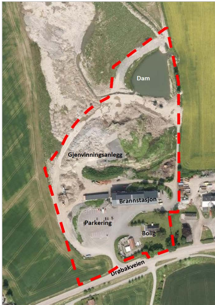
Figur 2 – Flyfoto av planområdet og eksisterende bebyggelse/aktiviteter

Korsegården brannstasjon ligger sør på eiendommen, mot Drøbakveien. Brannstasjonen stod ferdig i 2010. I tillegg til brannstasjon huser bygget også ambulansesentral og opplæringscenter for ambulanspersonell til Ullevål sykehus. Tilknyttet brannstasjonen er det etablert parkeringsplass. Drøbakveien Jord og Hagesenter hadde tidligere butikk innenfor området, men den er nå avviklet. I tillegg finnes en bolig, et våningshus, sørøst i planområdet. Flyfoto av planområdet er vist i Figur 2.