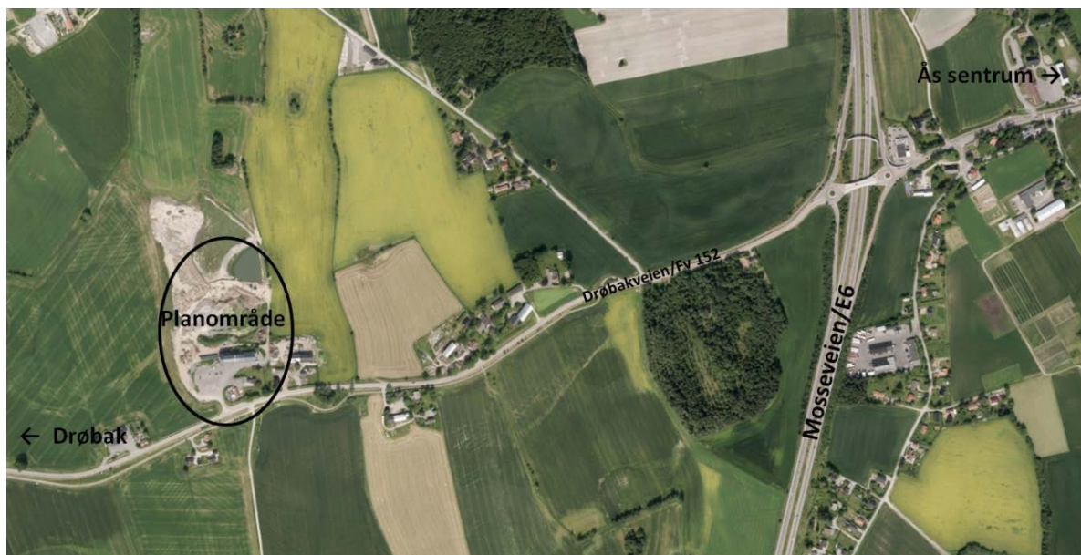
Figur 1 – Ortofotobilde med planområdets plassering (Bakgrunnskart fra norgebilder.no)

Planområdet ligger på Haug i Ås kommune. Området ligger nord for Drøbakveien, omtrent 1,2 km vest Korsegården (Figur 1). Området er en del av gården Haug nordre og ligger i et stort, åpent jordbruksområde.