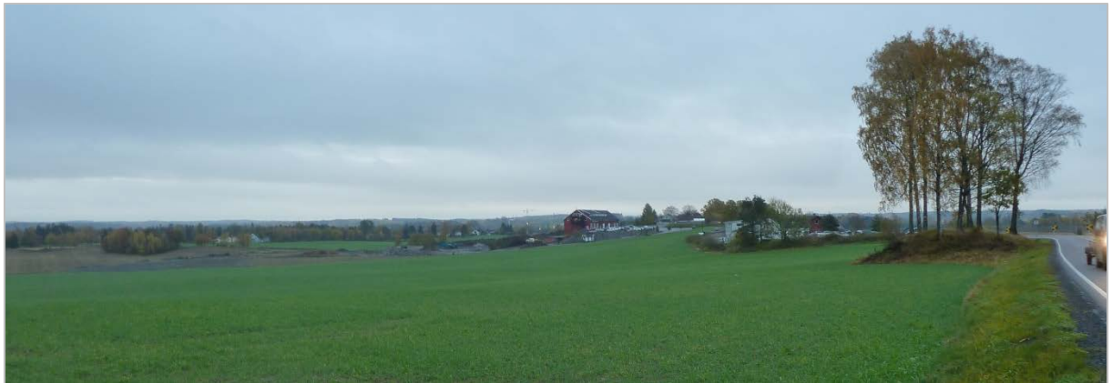
Figur 4 – Typisk landskap i området. Bilde tatt fra Drøbakveien. Brannstasjonen i planområdet sees midt i bildet.