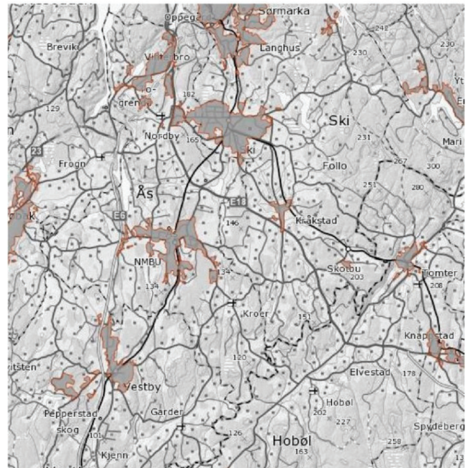
Figur 2: Tettbygd strøk i Ås i hht SSBs definisjon

Fra 2000 til 2015 har antall innbyggere i tettbygd strøk i Ås kommune økt fra 11133 til 15574. Antall innbyggere i spredte strøk har økt fra 2409 til 2878.