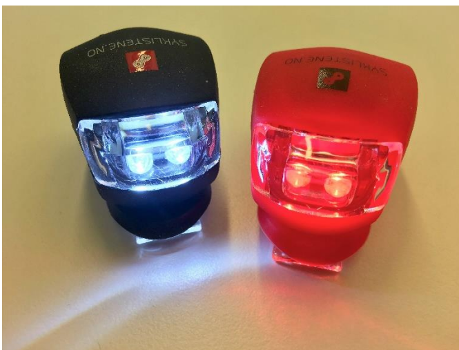
Syklistenes Landsforening deler hver høst ut tusenvis av lykter.

Ifølge TØI er det estimert at antall skadde og drepte syklist kan reduseres med 10 prosent dersom alle sykler med lys (9 prosent reduksjon i dagslys og 14 prosent reduksjon i mørke). Loven krever sykkellys både foran og bak når du sykler i mørke eller under dårlige siktforhold.