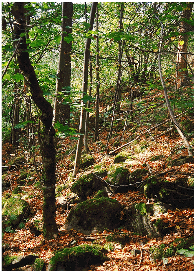
Figur 2. Edelløvsog ved Breivoll.

inneholder vegetasjonstyper og arter som foretrekker et svakt oseanisk klima og som er mer vanlige mot vest.