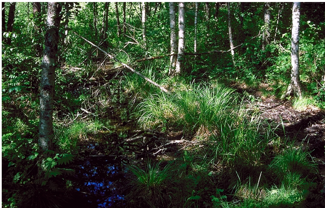
Figur 6. Sumpskogsparti ved Kjærnes.