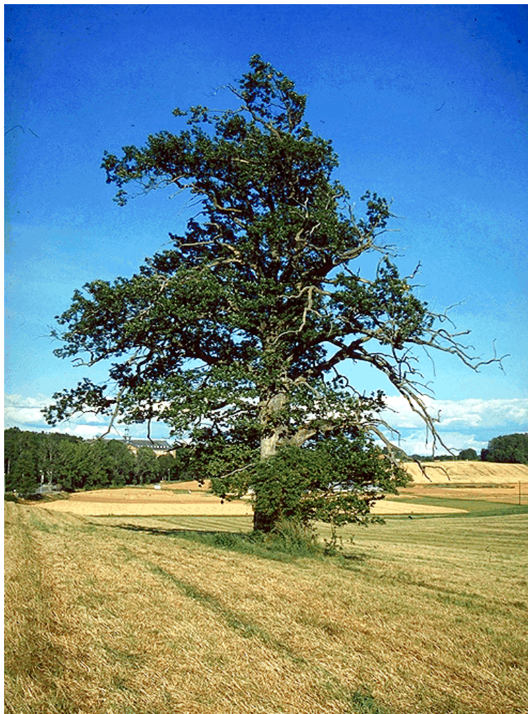
Figur 1. Gammel frittstående eik ved Vollebekk.