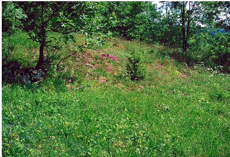
Figur 10. Engflora og kantvegetasjon ved Kjærnes.

Floraen er artsrik med flere interessante arter som er sjeldne i regionen, som stavklokke, hjertegras, bakkeforglemmegei, dunkjempe, marianøkleblom, åkermynte, flekkgrisøre, geitved og flere andre. Floristisk er lokaliteten blant de rikeste som er undersøkt og det varierte miljøet er trolig godt egnet også for andre organismegrupper som fugl og insekter. I følge Hansen (1993) er den sjeldne sommerfuglen herosommerfugl funnet ved Kjærnes.