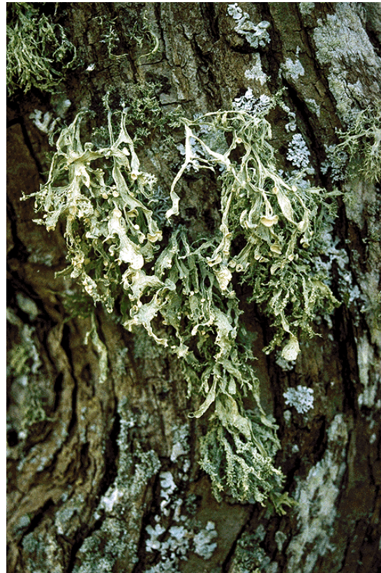
Figur 12. Askeragg – Ramalina fraxinea vokser på gamle edelløvtrær i kulturlandskapet.

Sør for gården Askehaug ligger en liten kolle med eikehage. Området er grunnlendt og tørt og floraen relativt fattig. Eiketrærne er imidlertid store og gamle og inngår i et variert landskap sammen med alléen inn til gården og Askehaugtjernet med rik vannvegetasjon.