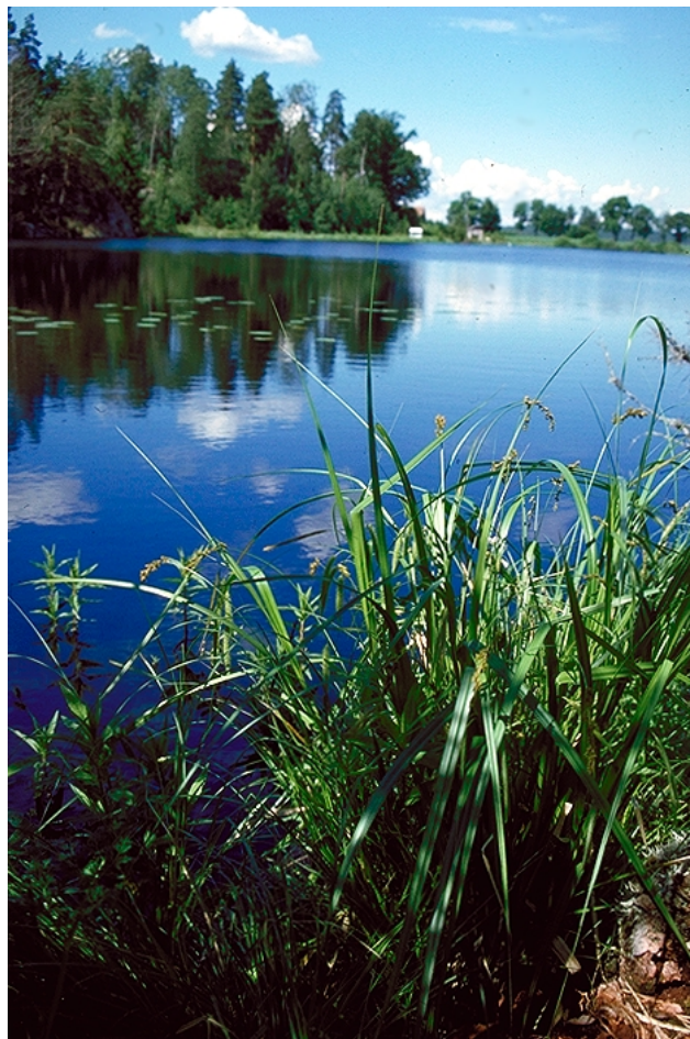
Figur 13. Våtmarksvegetasjon ved Askehaugtjernet.

Området består av relativt gammel, fuktig granskog med en del hassel. Skogen er hogstpåvirket, men det finnes noe dødt trevirke, det meste lite nedbrutt. Floraen er middels rik. Langs bekk i en liten kløft finnes gråorskog med til dels stor ask, skogsalat og strutseving. På gran vokste den noe kravfulle lavarten Lecanactis abietina .