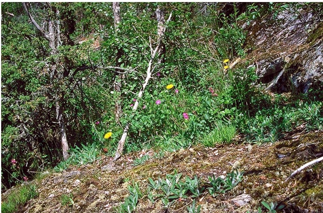
Figur 11. Kantkratt med rik flora ved Linneflaet.

Lokaliteten består av alm-lindeskog i veksling med lågurtgranskog i liten kløft og sørøstvendt skråning. Foruten furu og gran finnes ask, lind og hassel i tresjiktet. Lokaliteten ligger delvis under en bergskrent med rasmark under. Her finnes en del lind. En vei påvirker lokaliteten i overkant. Blåveis, trollbær og skogsalat er eksempler på arter som ble funnet.