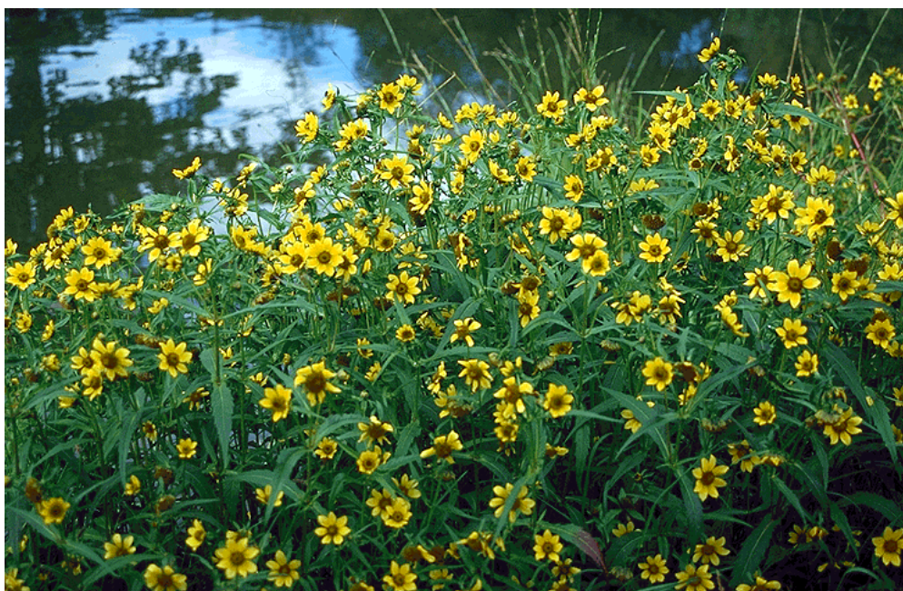
Figur 3. Nikkebrøndsle – Bidens cernua vokser i næringsrike vannkanter og er en sjelden art i Norge.

Verdsetting av hver lokaliteter ble foretatt etter kriterier angitt for hver naturtype i DN-håndboka. Kriteriene er nokså generelt utformet, så verdsettingen er skjønsmessig og dessuten basert på egne erfaringer med viktige naturmiljøer i kommunen. I håndboka er det spesifisert to kategorier, svært viktig og viktig. I tillegg ble det innført en tredje kategori, lokalt viktig.