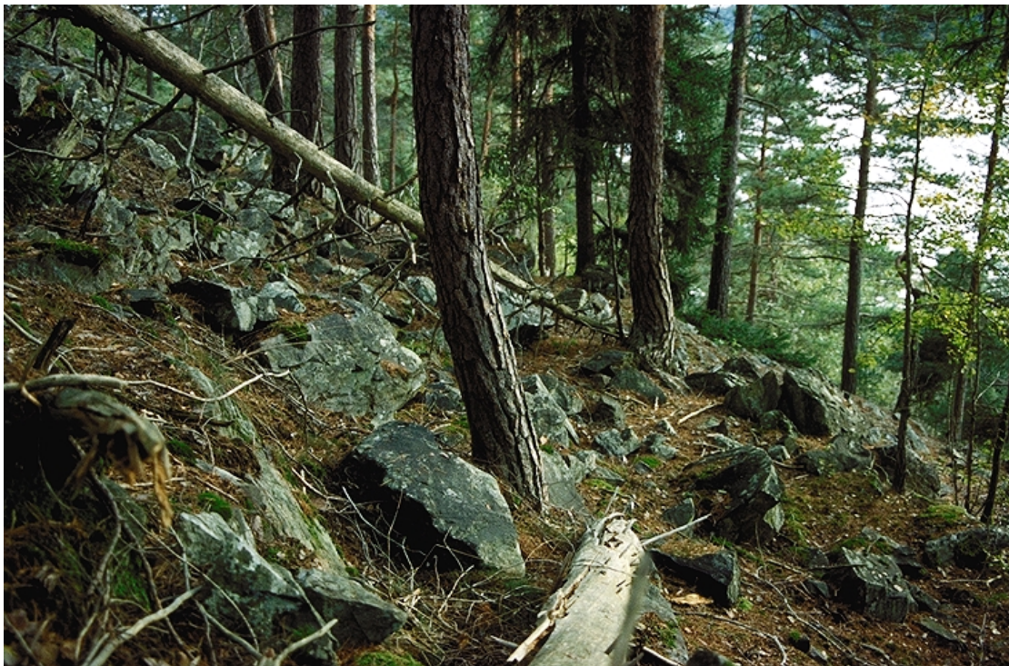
Figur 4. Furskog ved Vestnebbå.