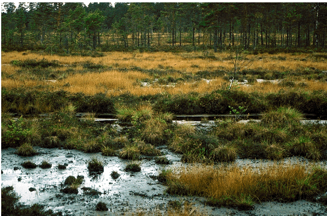
Figur 5. Tirudmosan