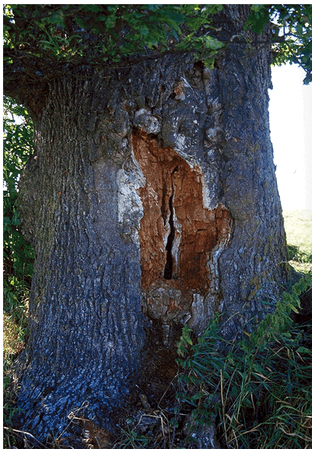
Figur 7. Gammel hul eik ved Vollebekk.