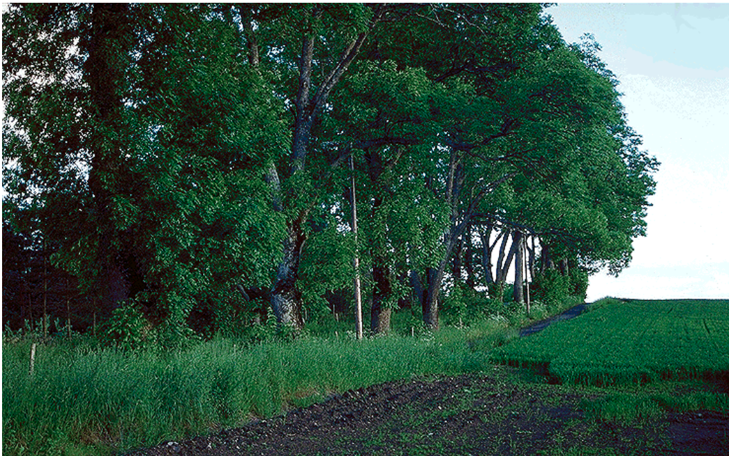
Figur 14. Allé ved Ris gård.

Dette er en monumental allé med store edelløvtrær, ask og lønn, mellom Ris gård og gårdene Sundby og Melby i sør (figur 14). På trærne finnes rike kryptogamforekomster, bl.a. askeragg, svart rosettlav og stor lindelav. Ved Ris gård står en meget gammel og grov eik. Eika er trolig viktig for insektfaunaen. Et steingjerde finnes stedvis langs alléen. Ved Skyssjordet er et system med flere dammer inkludert. Dammene ligger delvis inntil alléen og i omkringliggende, gjengroende ung hagemarkskog med hassel, selje og noen eldre eiketrær. Selv om det er partier med unge trær i alléen er hele området tatt med for å sikre sammenheng i lokaliteten og fordi yngre trær sikrer kontinuitet i lokaliteten.