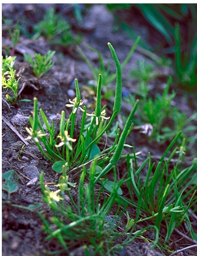
Figur 9. Muserumpe – Myosurus minimus er en sjelden art i Ås, som vokser på grunnlendt jord og leire i kulturlandskapet.

Mer problematisk var klassifisering av lokalitet 56 – ”Nord for Kaksrudødegården”, som består av en mosaikk av rikere skogtyper, med hovedvekt på rik barskog med et framtrædende undersjøkt med hassel, flekker med rik edelløvsog og fuktige søkk og bekker. Barskogen i Ås er gjennomgående såpass påvirket av skogbruk at naturskogkvaliteter kun finnes i begrenset grad. Viktige barskogtyper må derfor avgrenses ut fra andre lokalt tilpassede kriterier. I Ås har bl.a. artsrik skogbunnsflora med forekomst av basekrevende karplanter og moser, innslag av edelløvtrær og moserike bergvegger gjerne med basekrevende arter, blitt benyttet ved identifikasjon. Det er trolig behov for å innføre en type for å fange opp slike skogtyper, som i et intensivt drevet skoglandskap er viktige og som dessuten vektlegger andre aspekter ved det biologiske mangfoldet enn det som fanges opp i naturskogbegrepet slik det er beskrevet i DN-håndboka.