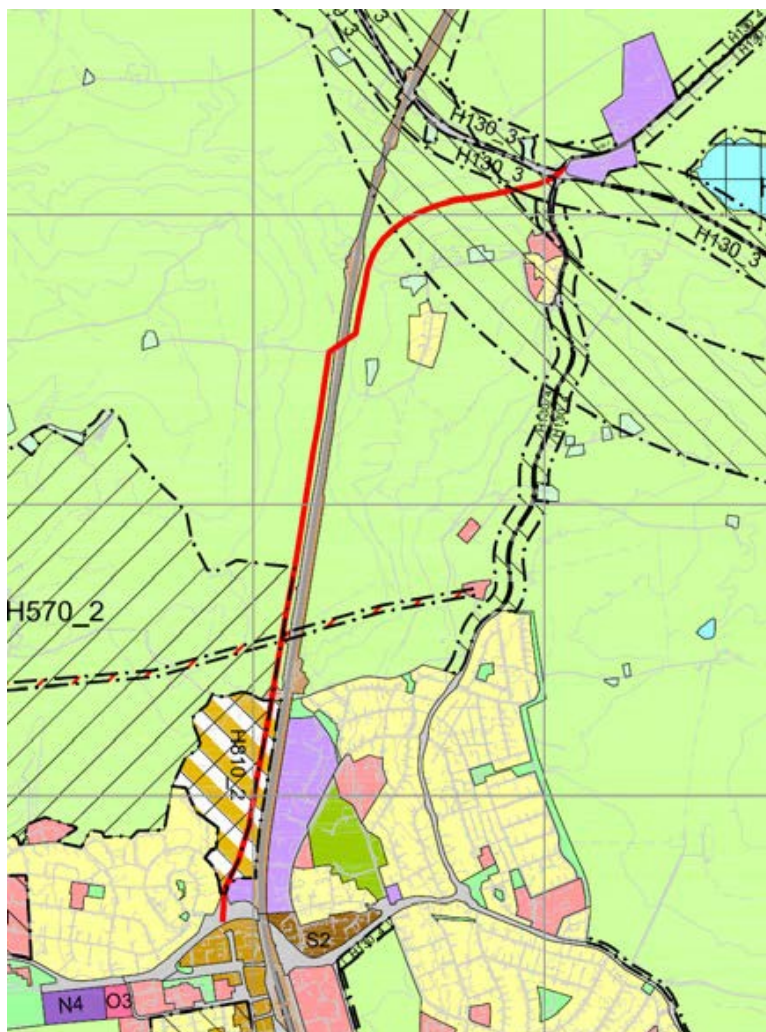
Figur 1. Utsnitt fra kommuneplanens arealdel. En mulig ny trasé for fv. 152 er vist med rød linje.

Planområdet strekker seg fra Ås sentrum, ved Esso-tomta, frem til rundkjøringen på dagens E18 på Holstad. Planforslaget berører hovedsakelig områder som er avsatt til jernbaneformål og LNF-formål i kommuneplanen. Deler av området avsatt til LNF-formål omfattes av hensynssone bevaring kulturmiljø, H570_2. Helt sør i planområdet berøres en del av Åsmåsan som er avsatt til kombinert bebyggelse og anlegg med krav om felles planlegging, samt Esso-tomta, som er avsatt til eksisterende næringsbebyggelse. Esso-tomta er en del av kjerneområdet for ny bebyggelse i fortettingsstrategi for Ås sentralområde.