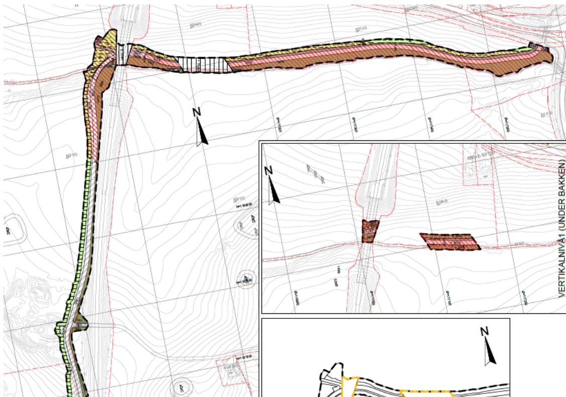
Figur 2. Utsnitt fra plankart, datert 01.02.2019