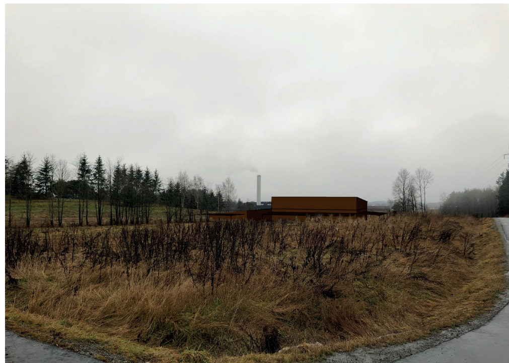
Planområdet sett fra kryss Syverudveien/Arboretveien