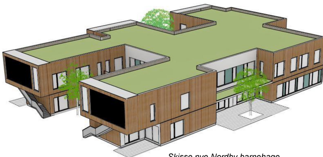
Skisse nye Nordby barnehage