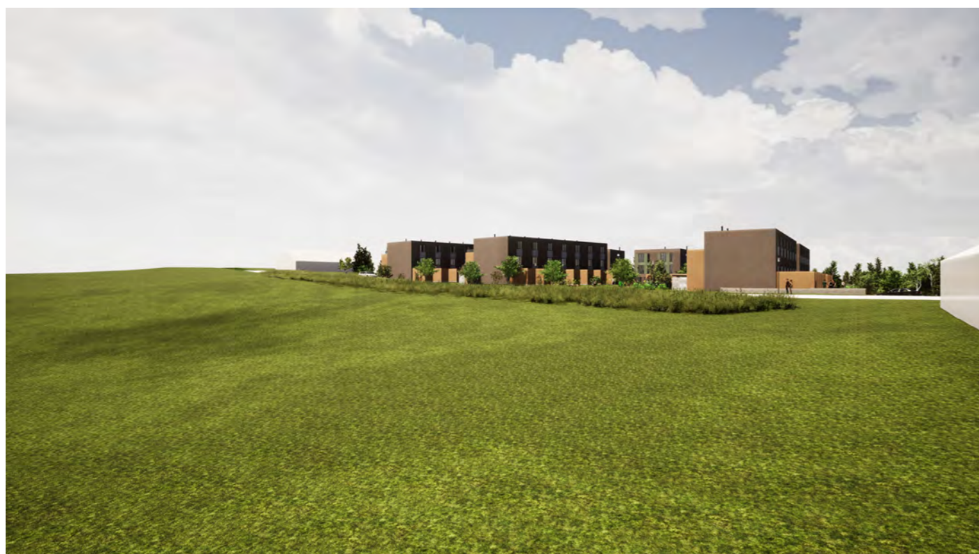
Ny bebyggelse sett fra jordet mot sørvest