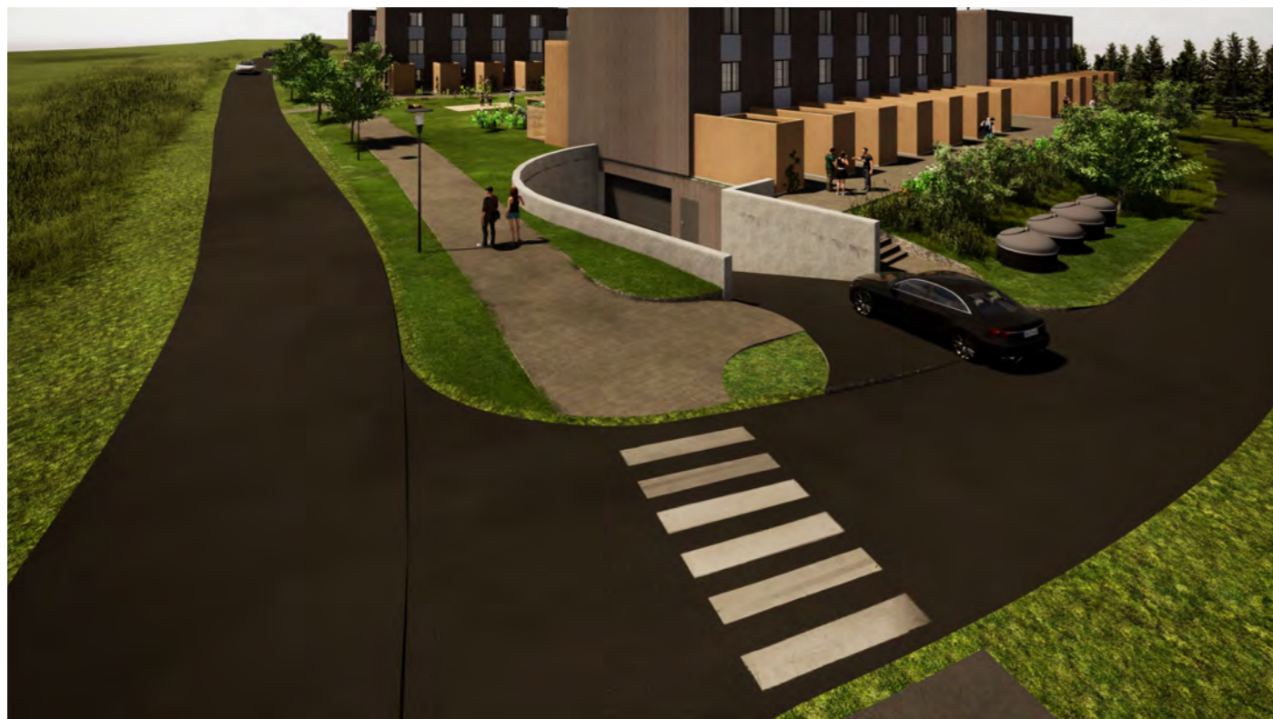
Ny bebyggelse sett fra Brekkeveien, nedkjøring til garasjeanlegg