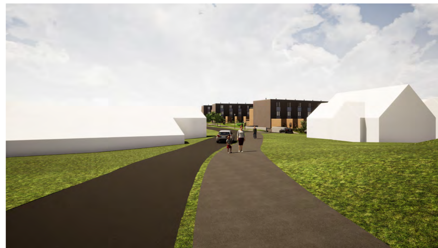
Ny bebyggelse sett fra Brekkeveien mot sør (veksthus til venstre)