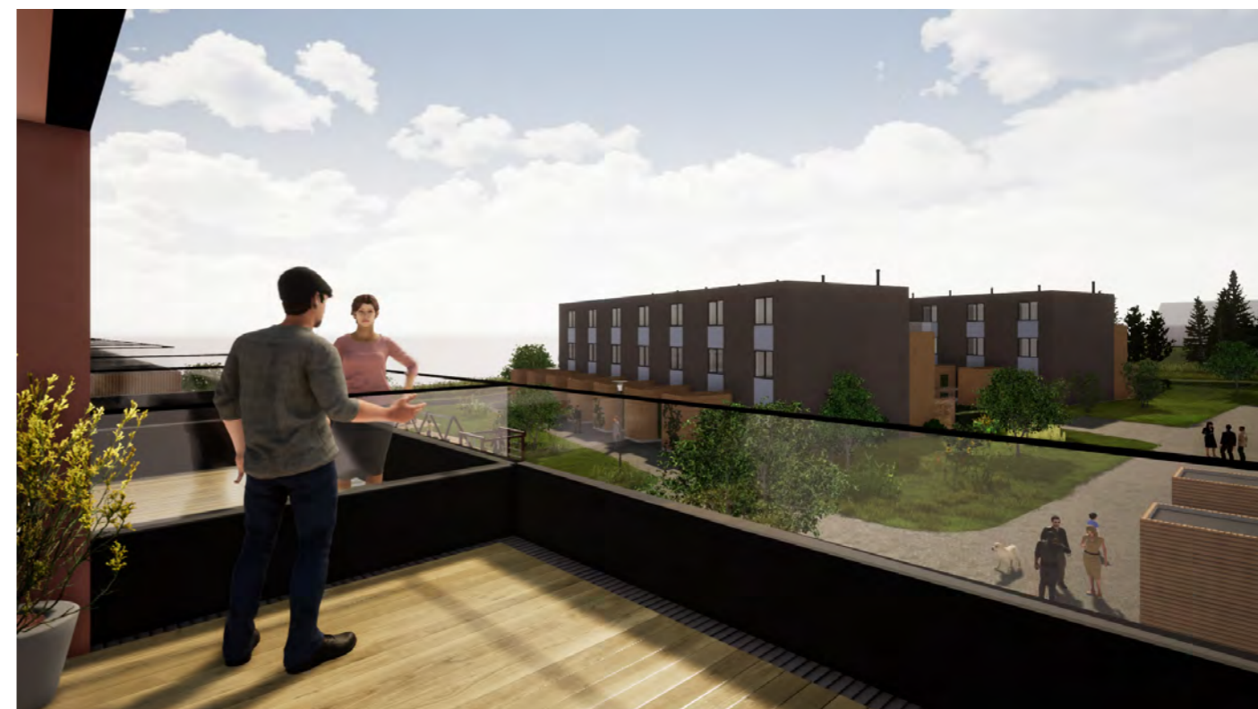
Utsikt fra takterasse