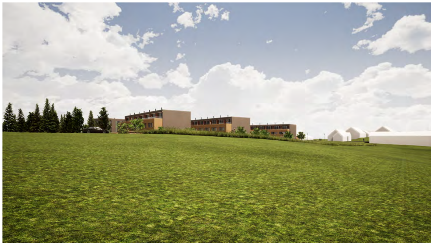
Ny bebyggelse sett fra jordet mot nordvest