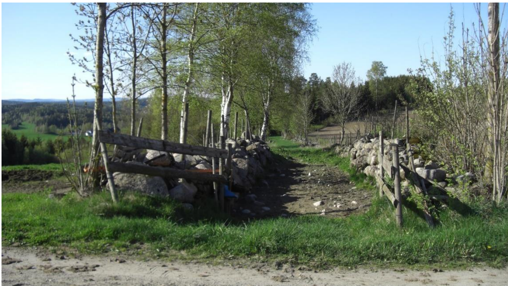
Fegate Roås.

Kantsoner mellom jordbruksareal og skog og store frittstående trær er eksempler på sentrale elementer i Follo jordbrukslandskap.