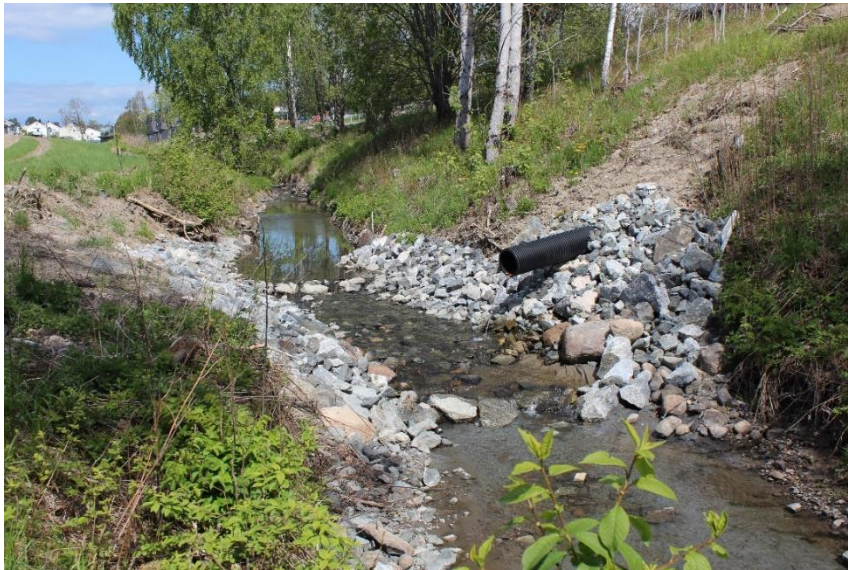
Erosjonshindrende tiltak i Skibekken.