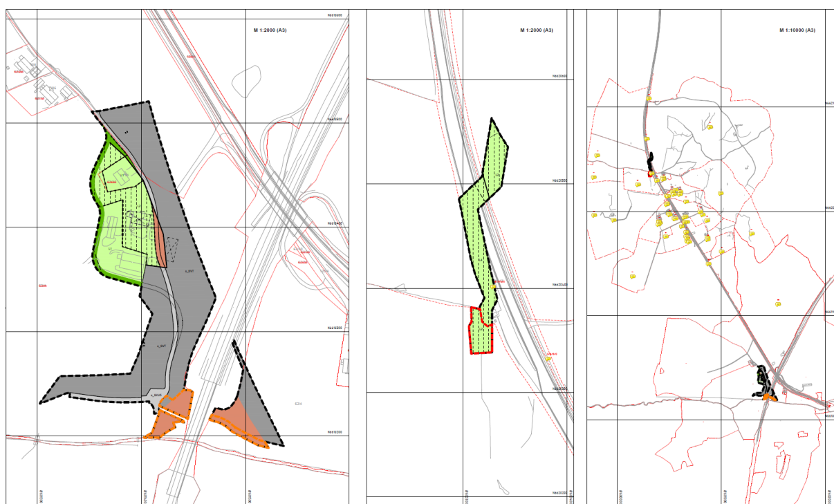
Fig.2 Forslag til reguleringsendringer, Holstad- Øvre, Riis og endringene vist i forhold til hverandre.