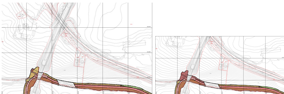
Fig.3 Vedtatt plan og forslag til endring av reguleringsplan gang- og sykkelvei fra Esso til Holstad. Endring driftsvei Holstad- Øvre.