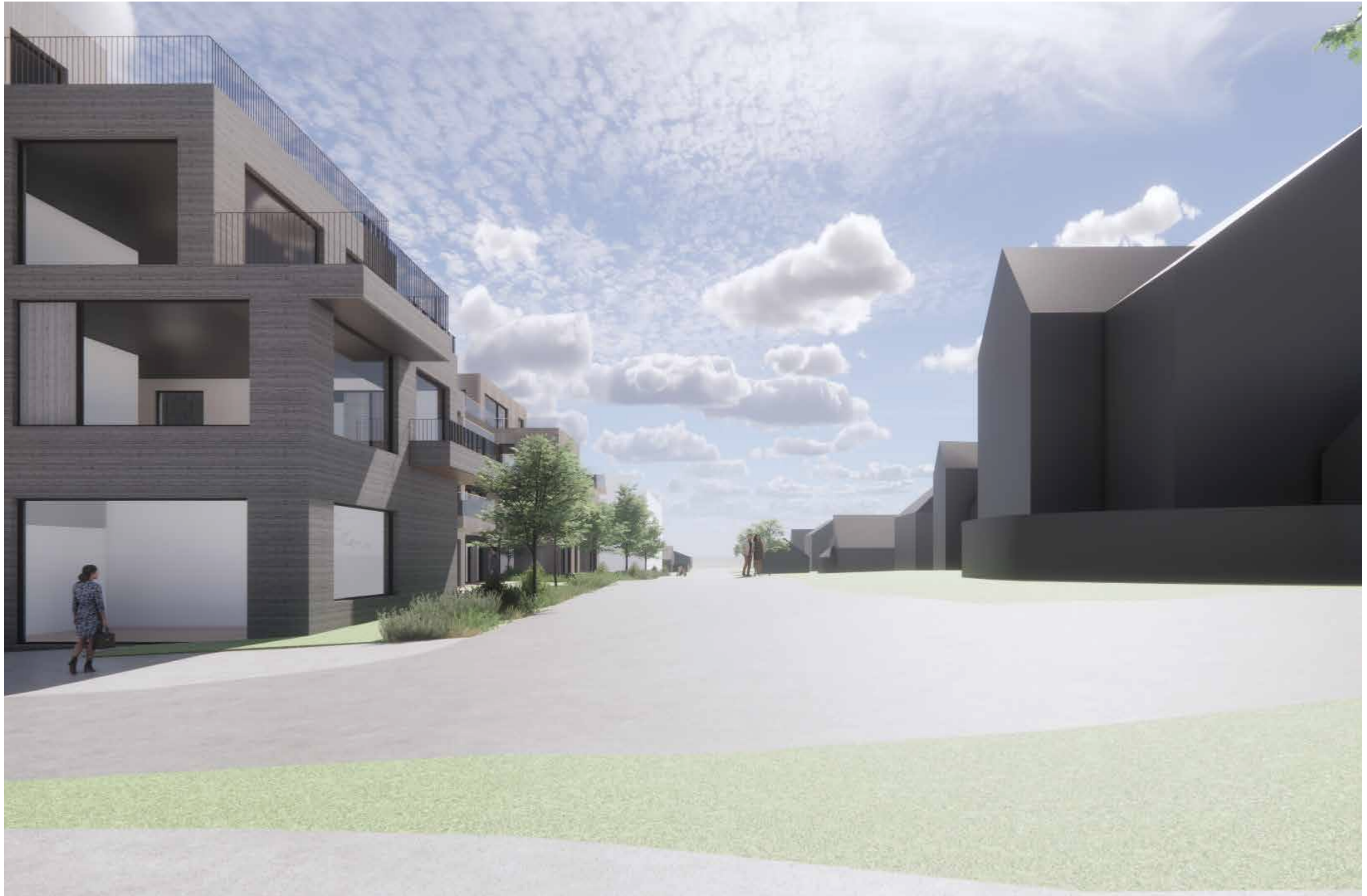
06_Fjernvirkning_Sagaveien, mot syd fra krysset Skoleveien/Sagaveien