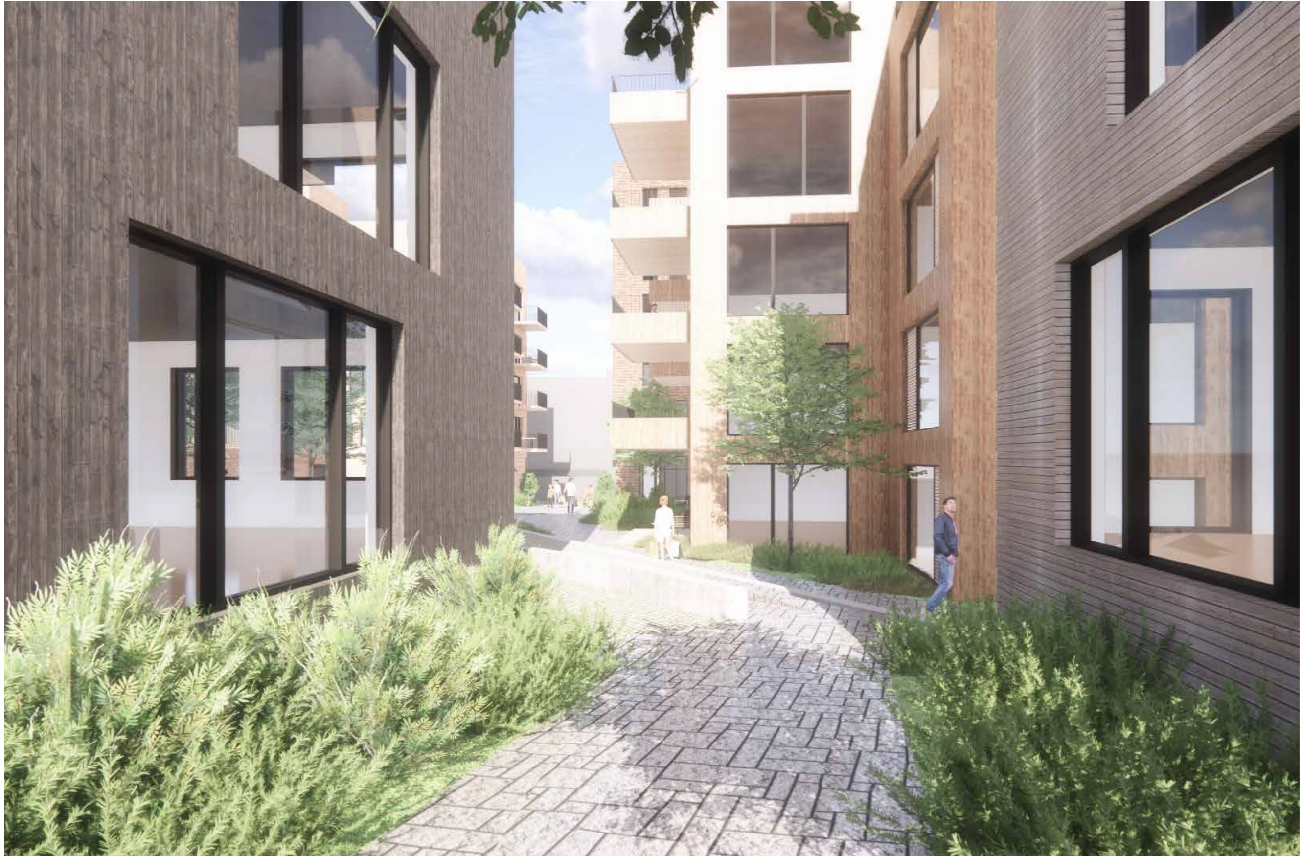
11_Nærvirkninger_Gjennomsyn gjennom gårdsrom fra Sagaveien til Moerveien