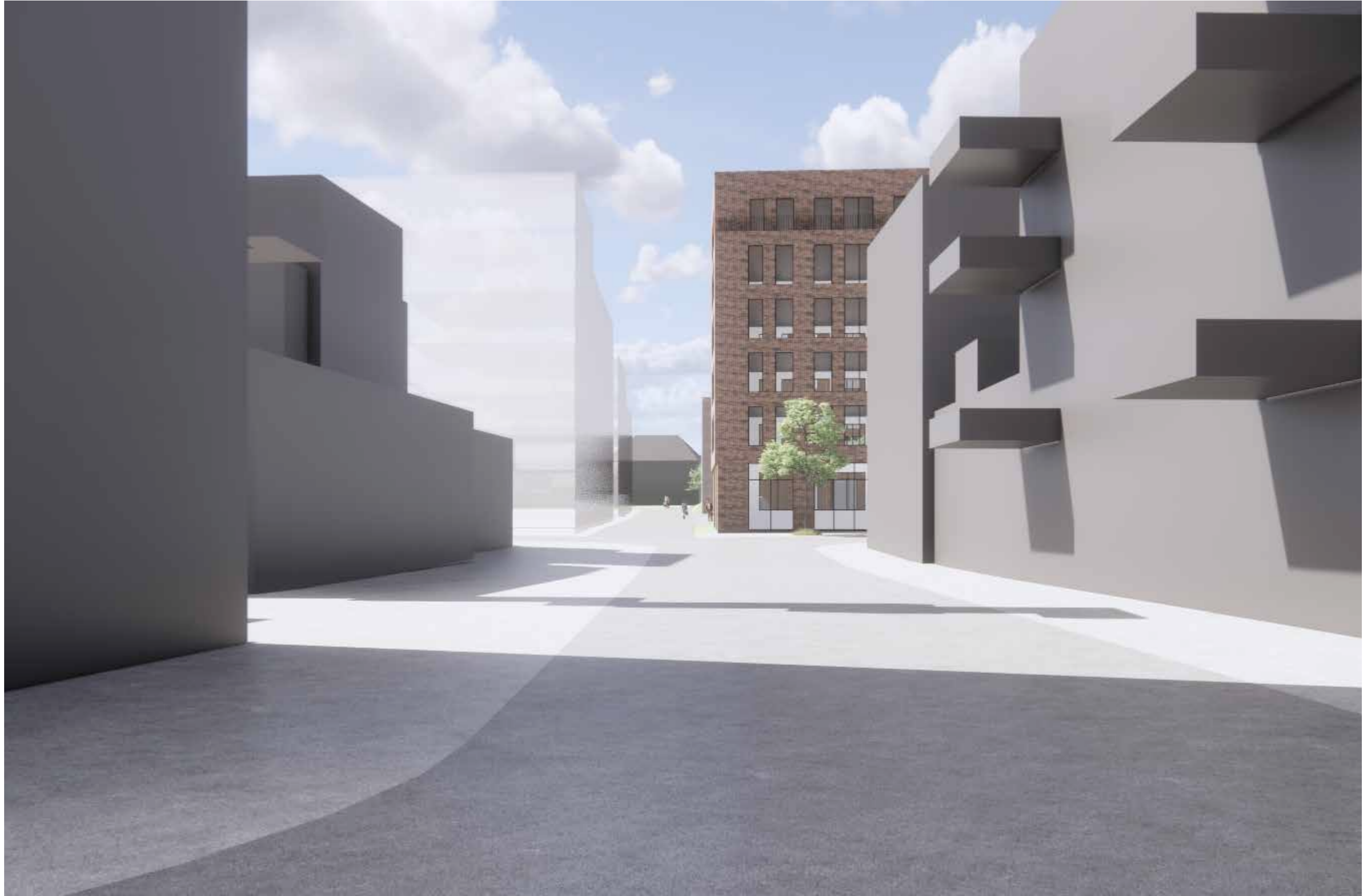
07_Fjernvirkning_Brekkeveien, mot vest mot o_SGT