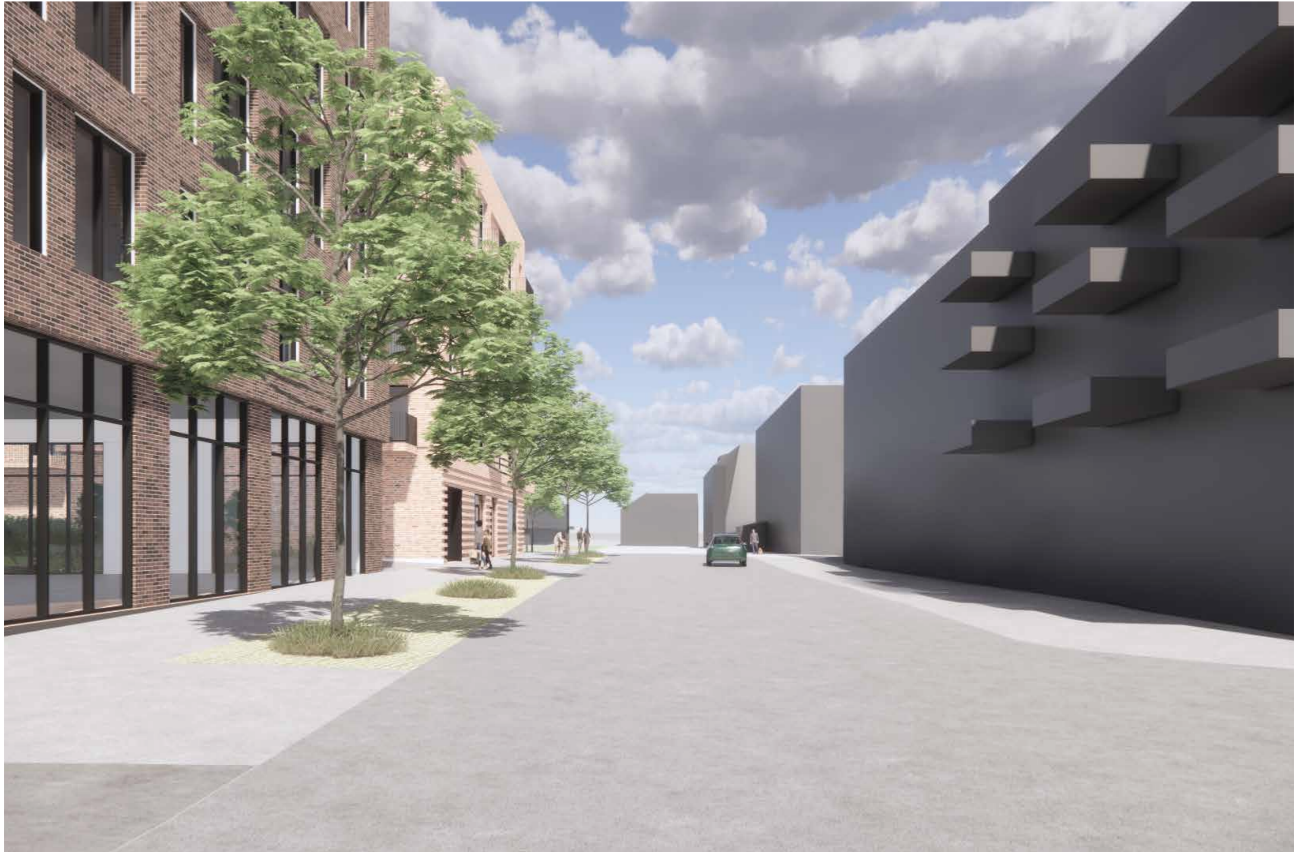
04_Fjernvirkning_Moerveien, mot nord fra krysset o_SGT/Moerveien