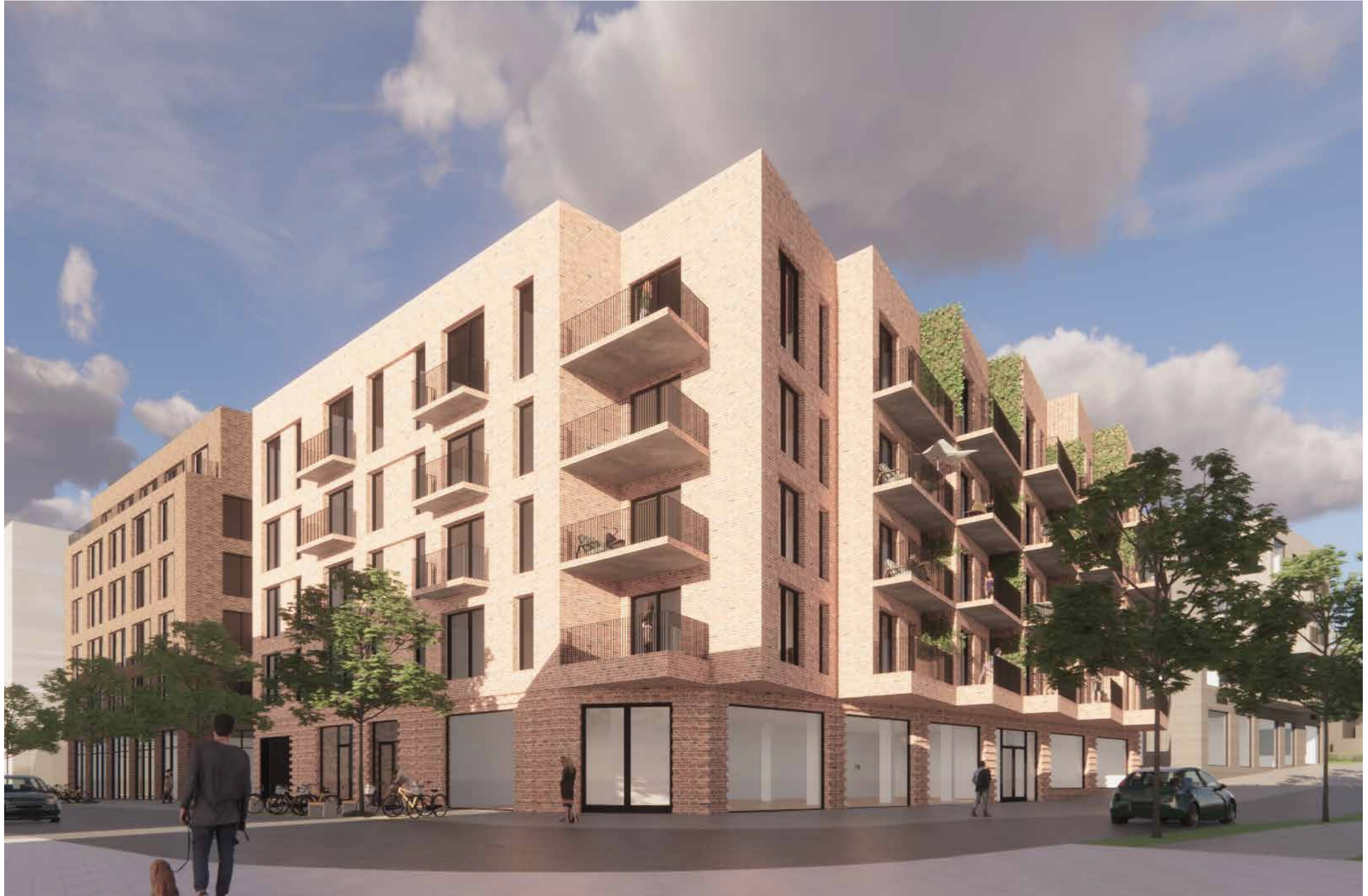
12_Nærvirkninger_Moerveien, mot sydvest krysset Moerveien/Skoleveien