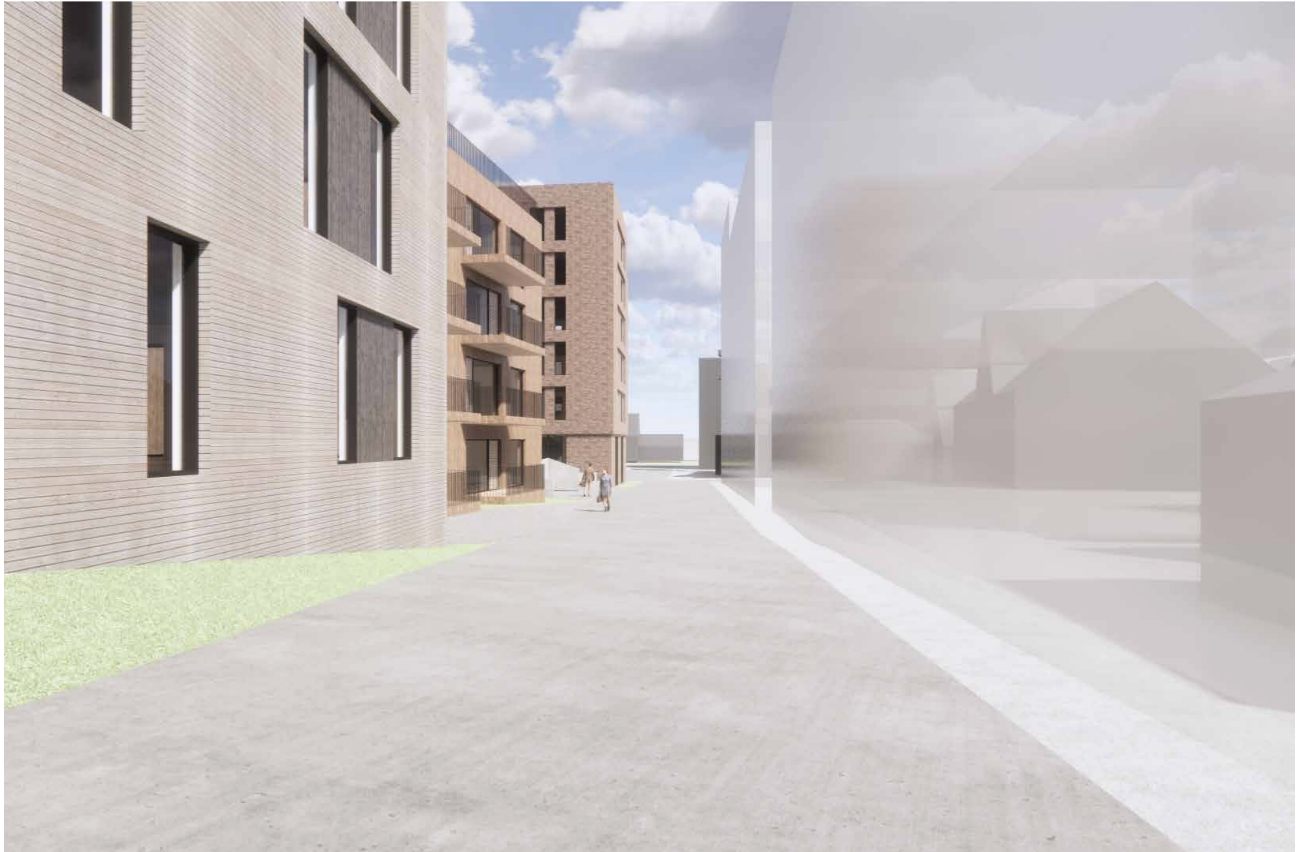
09_Nærvirkninger_SGT sett fra vest (BS6 til høyre)