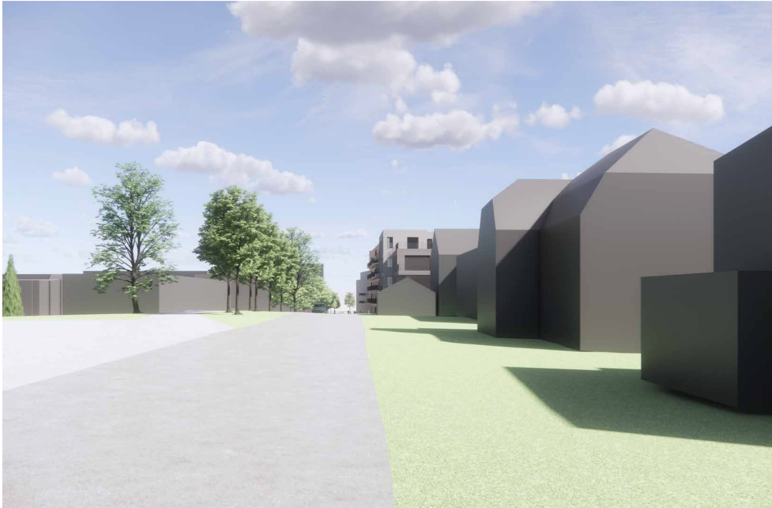
01_Fjernvirkning_fra Åsgård skole mot øst