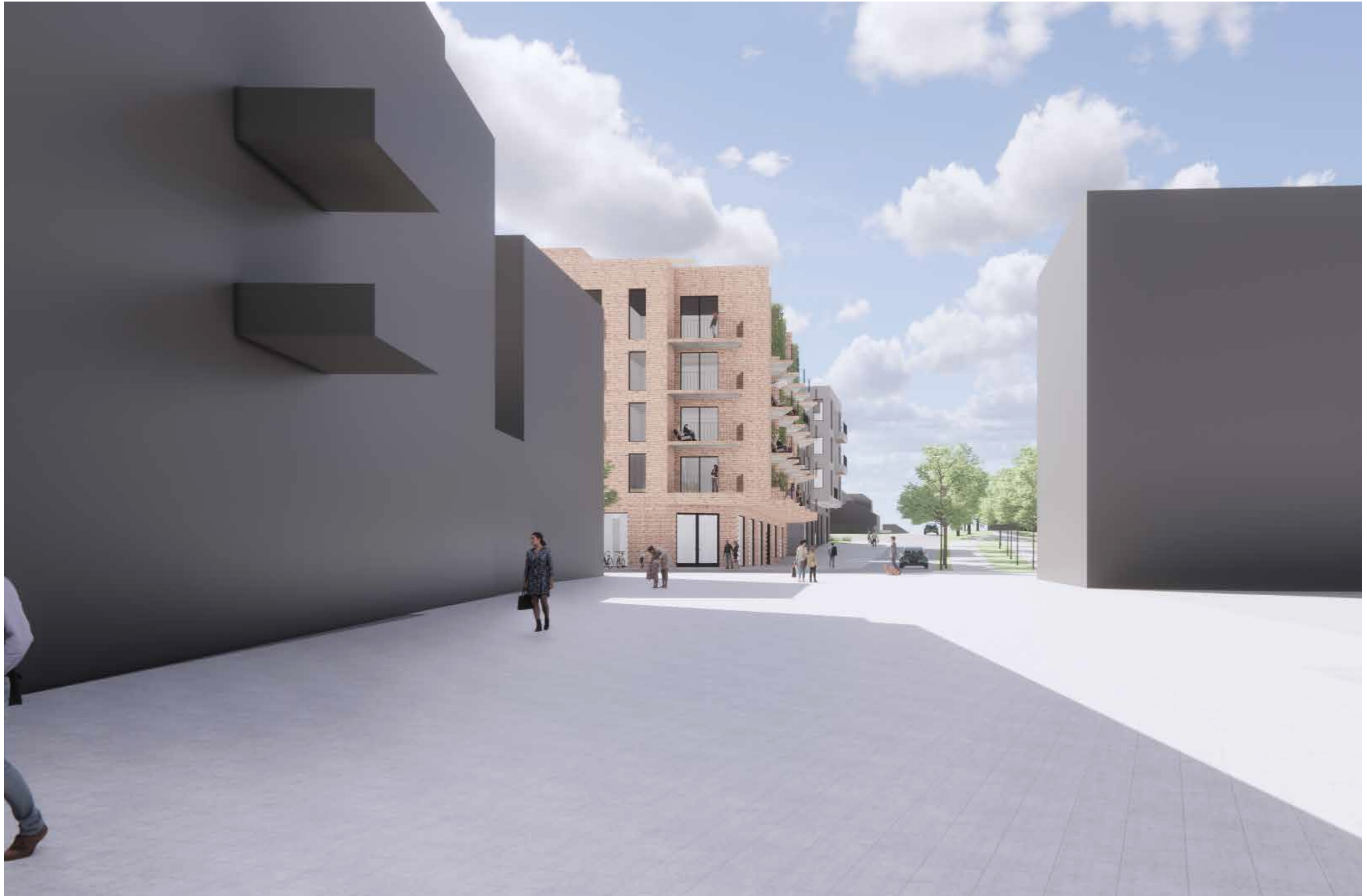
13_Nærvirkninger_Passasje fra tog