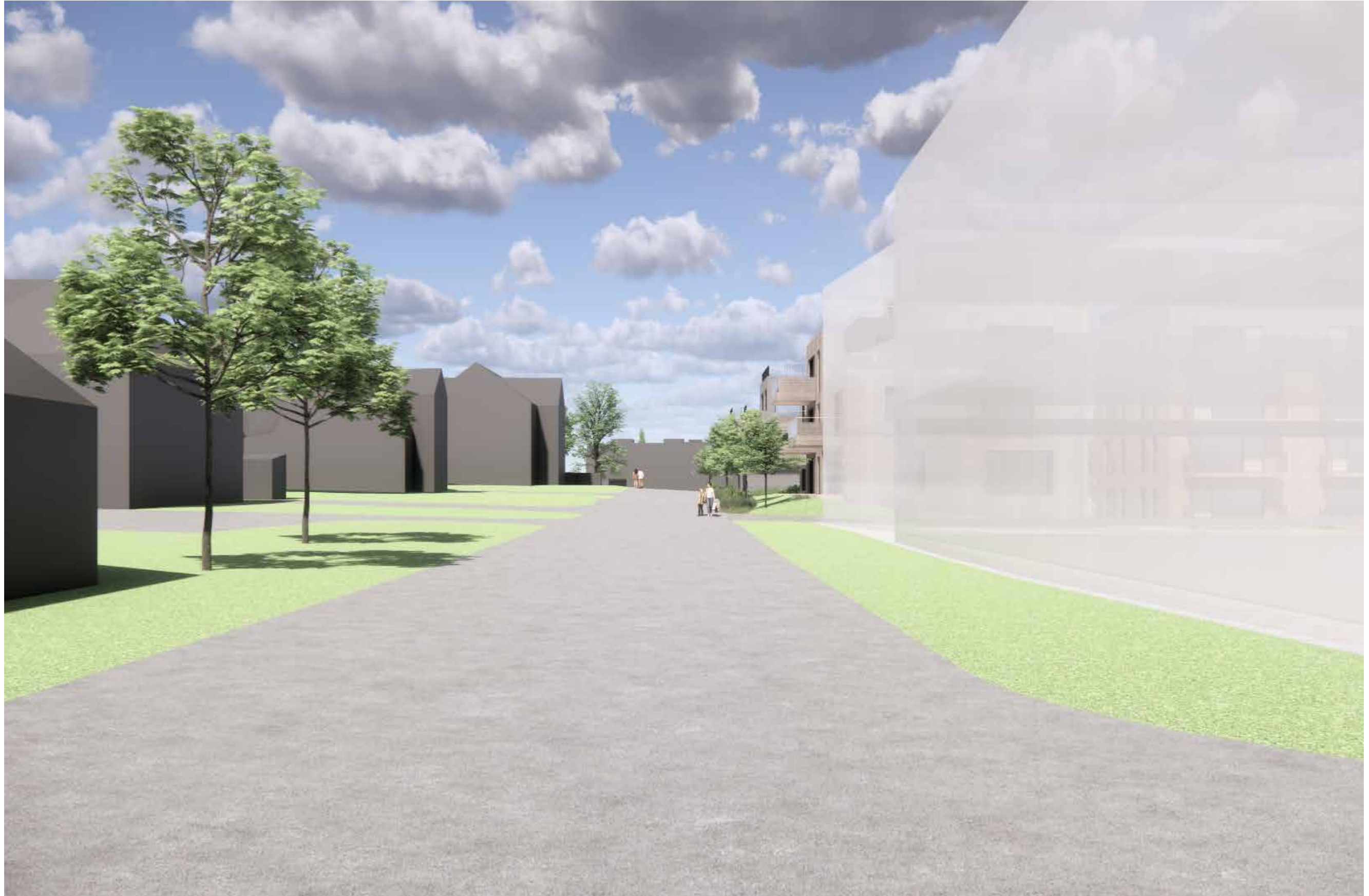
05_Fjernvirkning_Sagaveien, mot nord fra krysset Tverrveien/Sagaveien (BS6 i forgrunnen til høyre)