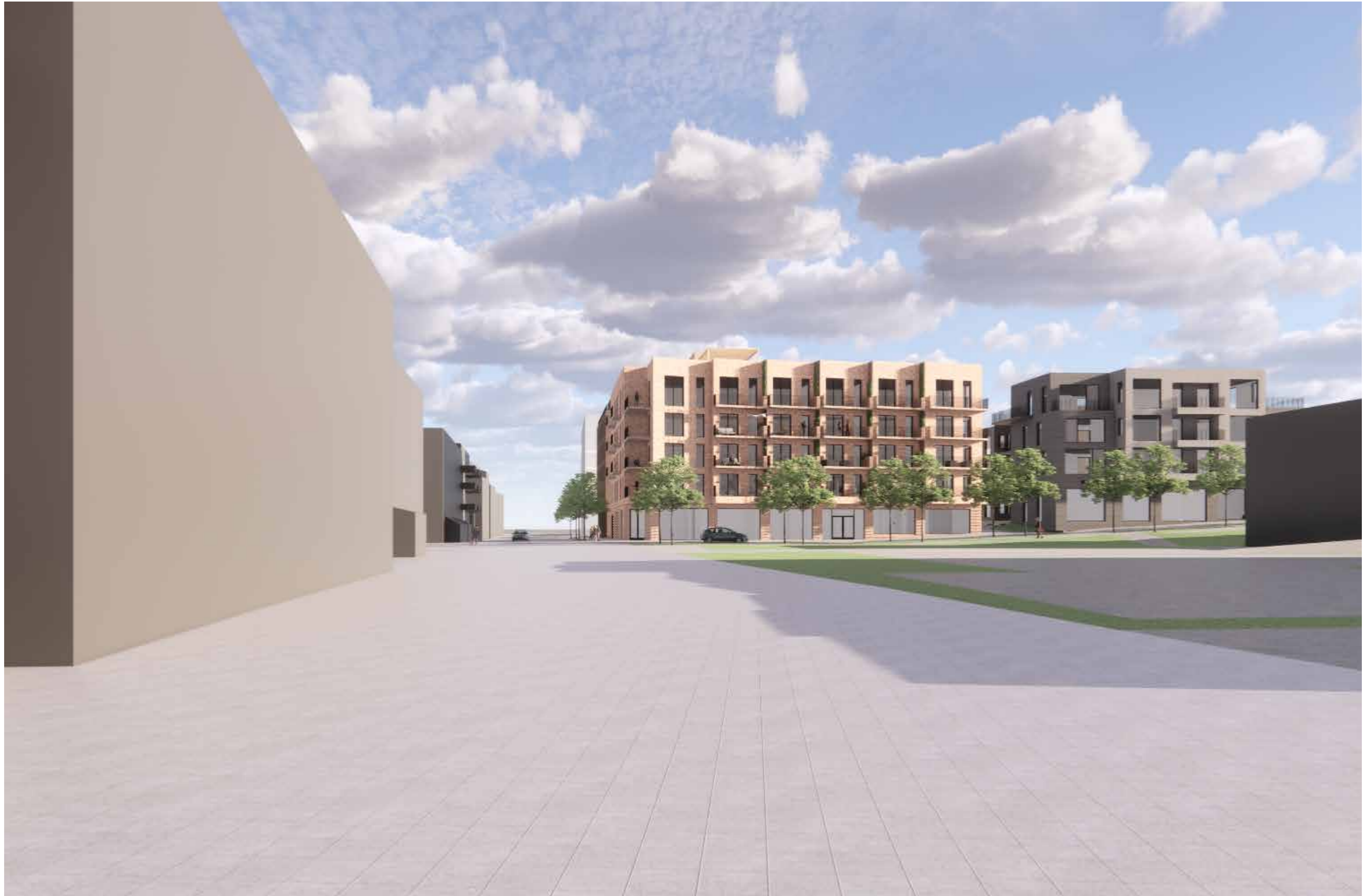
02_Fjernvirkning_Moerveien, mot syd fra krysset Rådhusplassen/Moerveien