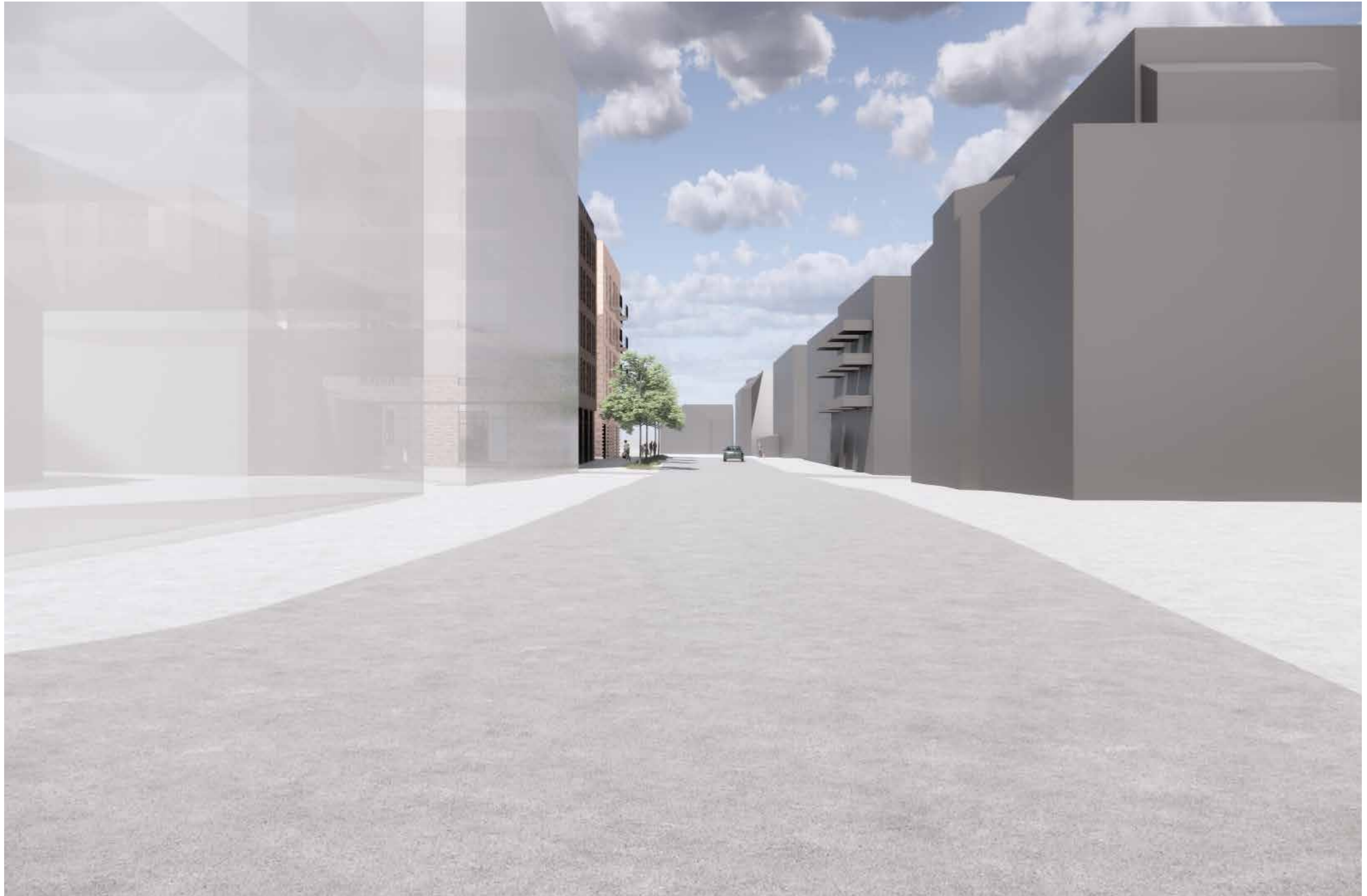
03_Fjernvirkning_Moerveien, mot nord fra krysset Tverrveien/Moerveien (BS6 i forgrunnen til venstre)