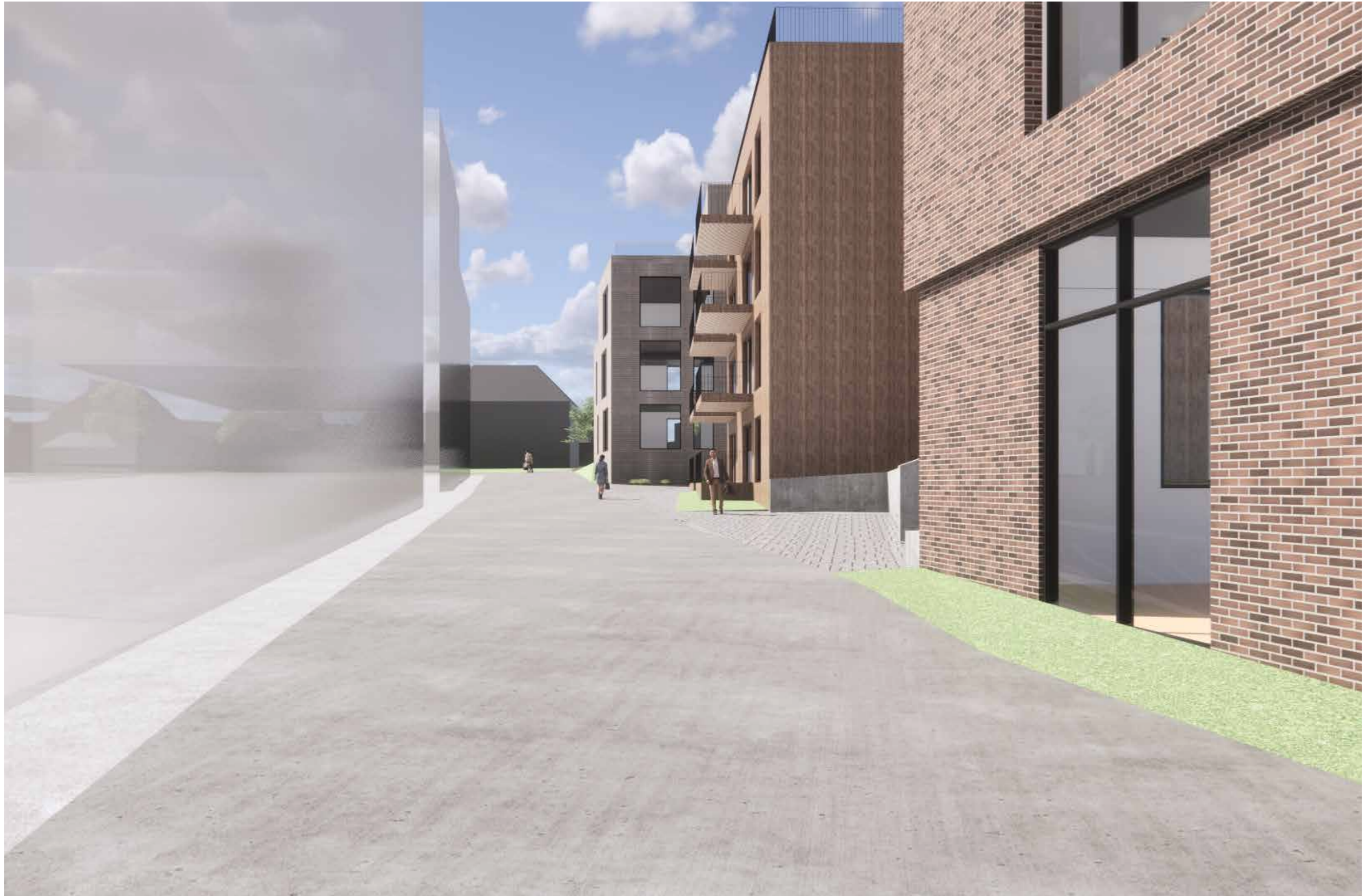
08_Nærvirkninger_SGT sett fra øst (BS6 til venstre)