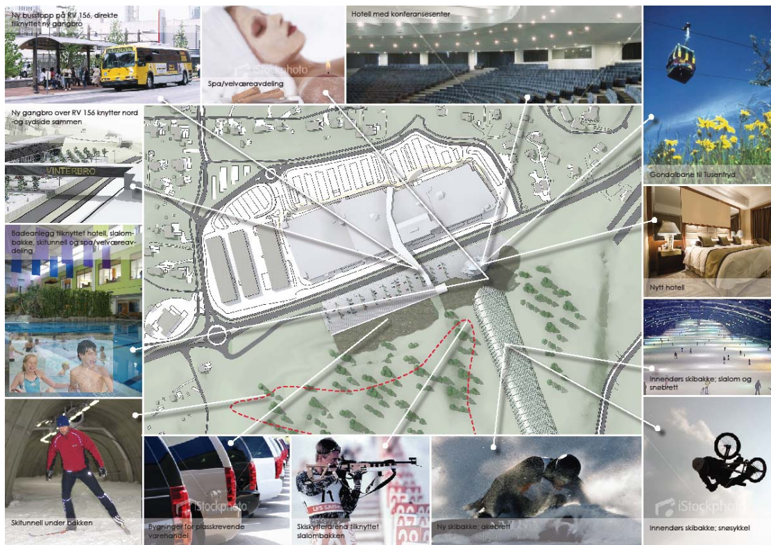
Illustrasjonen summerer opp de sentrale elementer knyttet til Steen & Strøms ønske om utviklingen på Vinterbro. Illustrasjon: Arcasa arkitekter.

Utfordringene ved å realisere de foreslåtte tiltakene er delvis beskrevet i andre utredninger tilknyttet kommunedelplanen. Her understrekes særlig utfordringene knyttet til å integrere tiltakene på en naturlig og god måte i lokalsamfunnet, slik at tiltakene blir stedsutviklende og tilrettelagt for bruk av stedets innbyggere. Utredningen anbefaler å dreie fokus i ny bebyggelse på sydsiden av RV 156 mer i retning av helse, trening, sport og ta lokale aktører med i planlegging og ordninger for fremtidig bruk.