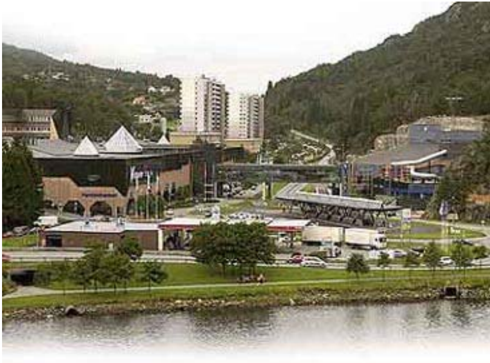
Vestkanten kjøpesenter i Loddefjord med tilknyttet Vannkanten badeland og Iskanten is- og curlighall.

Ishall med curling og badeanlegg med tilknyttet bowlinghall er sentrale aktiviteter i Vannkanten og Iskanten til knyttet Vestkanten kjøpesenter i Loddefjord. Her har Stor-Bergen boligbyggelag (som har mange boliger i Loddefjord) vært en sentral aktør.